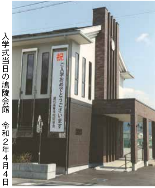
入学式当日の鳩陵会館 令和2年4月4日

去る5月30日(土)に開催予定であった、令和2年度総会は、コロナウイルスによる新型コロナウイルスの感染拡大に鑑み、開催を中止し「総会を開く余裕のない時、代わって役員会は会務を議決する」(会則第9条)に基づき、その議案が承認された。