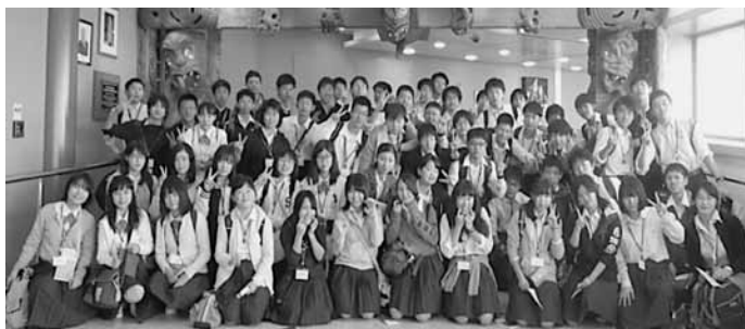
ファミリーの皆様の協力に感謝致します。

ホブソンビルは開校されたばかりの小学校で、スポーツ、ヒップホップダンスなど4グループに分かれ、このような機会を持つことが出来る本校の生徒は本当に幸せです。保護者の皆様、学校、同窓会、ホスト